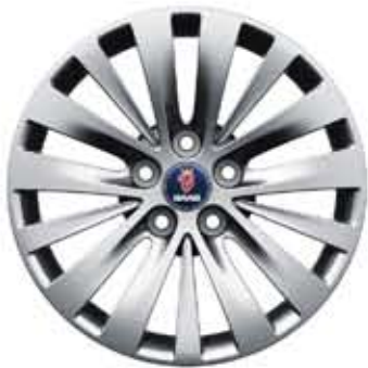
Roues alu 15 branches Rotor 18×8" (ALU 103)