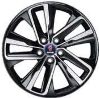
Roues alu 10 branches Edge noire brillante 19×8½" (Accessoire)