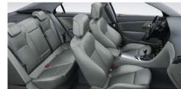
Sièges confortables cuir/textile. Garniture grise. Intérieur Jet Black/gris. Inserts de porte gris. (Vector)