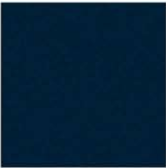
Bleu Fjord métallique