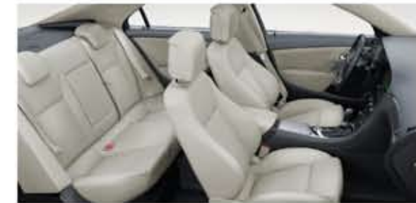
Sièges confortables en cuir. Garniture beige. Intérieur Jet Black. Inserts de porte beiges. (Option)