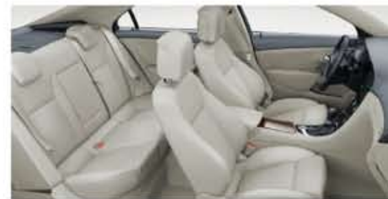
Sièges confortables en cuir. Garniture beige. Intérieur Dark Cocoa/beige. Inserts de porte beiges. (Option)