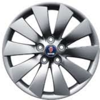
Roues alu 10 branches Turbine 19×8½" (ALU 105)