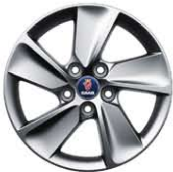
Roues alu 5 branches Blade 17×7" (ALU 100)