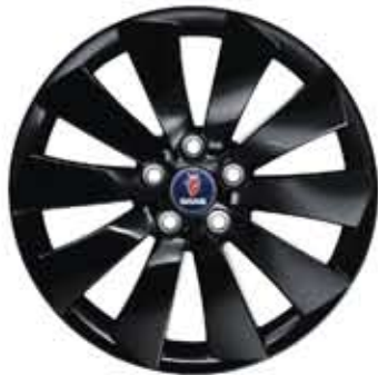
Roues alu 10 branches Turbine noire 19×8½" (Accessoire)