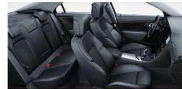
Sièges en cuir perforés. Garniture Jet Black. Intérieur Jet Black. Inserts de portes Jet Black. (Option)