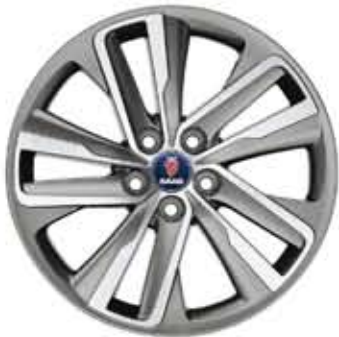
Roues alu 10 branches Edge grise 19×8½" (Accessoire)