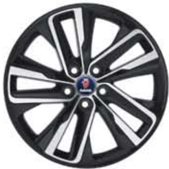
Roues alu 10 branches Edge 19×8½" (ALU 104)