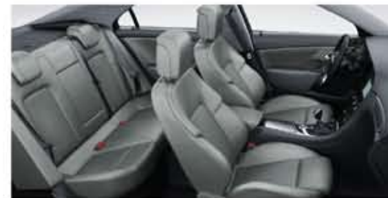
Sièges cuir sport perforés. Garniture grise. Intérieur Jet Black. Inserts de porte gris. (Aero)