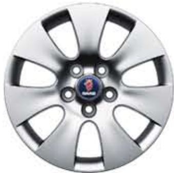
Roues alu 7 branches Core 17×7" (ALU 101)