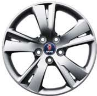
Roues alu 5 branches Carve 18×8" (ALU 102)