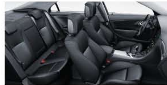
Sièges confortables en tissu. Garniture Jet Black. Intérieur Jet Black. Inserts de porte Jet Black. (Linear)